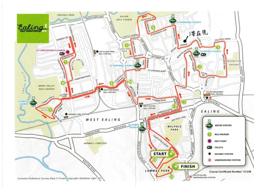
商店街と住宅街の複雑なルートのコース

コースは区内の商店街と住宅地をできるだけ多く回るように目の回る様な複雑なルートとなっていました。私も滞在先の直ぐ近くのMount Avenueと言う通りもルートだったので、沿道で声援を送りました。男性1位は1時間5分41秒、女性の1位は1時間16分32秒でまずまずの記録だったと思います。大人とは別に、公園内1マイル(1.6km)を走る6歳～11歳までと12歳～16歳の二グループに分かれた子供部門のレースも行われました。主催者の話では約300人のランナーが各々のチャリティの名目を大会前に宣言して、例えばアフリカ難民救済や小児盲人救済等々と書かれたタスキをかけ指定の募金用バケツを下げていると走っていました。今日のローカル紙にはチャリティ募金総額は£16,000(約300万円)集まったと報じられていました。