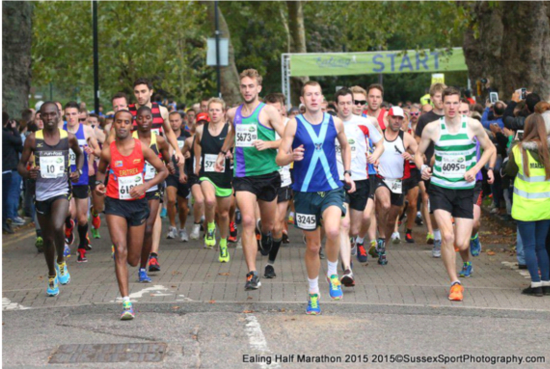
Ealing Half Marathon 2015