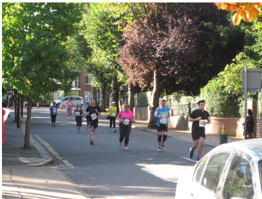
09:00 にワールプール公園をスタートした直後の市民ランナーの様子