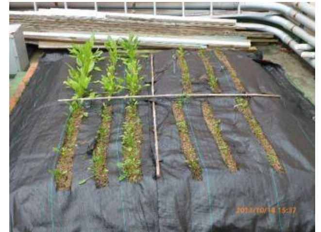
写真6 全体の状況(除草後)