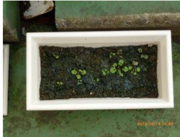
写真5 我が家の土では雑草が芽生えた。