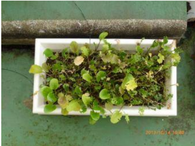
写真4 比較プランターは勢いが良かったが、 間引かなかったなので伸び悩み。 虫に葉を食べられた。