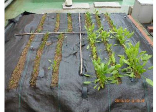
写真3 全体の状況(反対側から撮影) Aでは表土乾燥が顕著