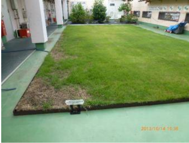
写真1 初芝くんの回復状況