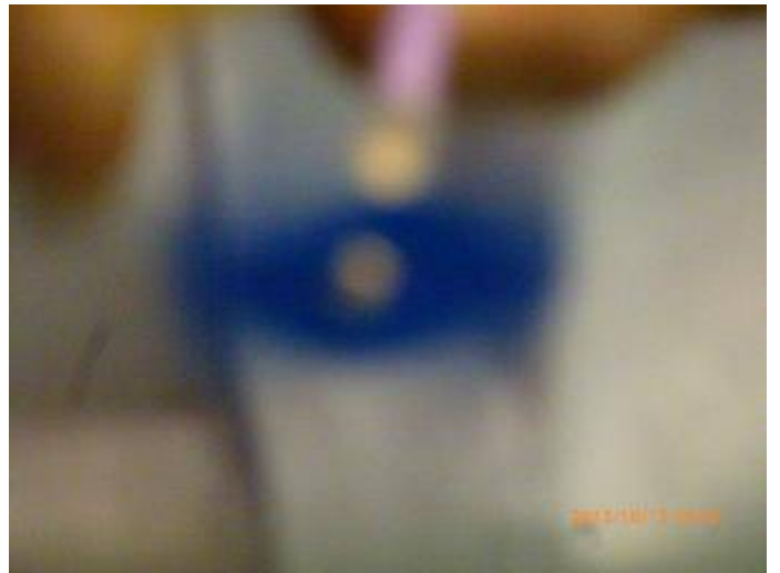
写真10 よく回転している。一応これも竹製品