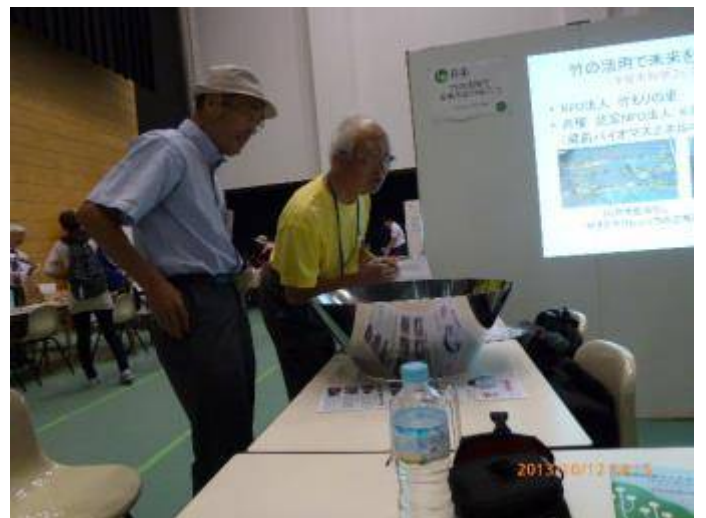
写真16 隣ブースの技術士会の説明員も見に来た。