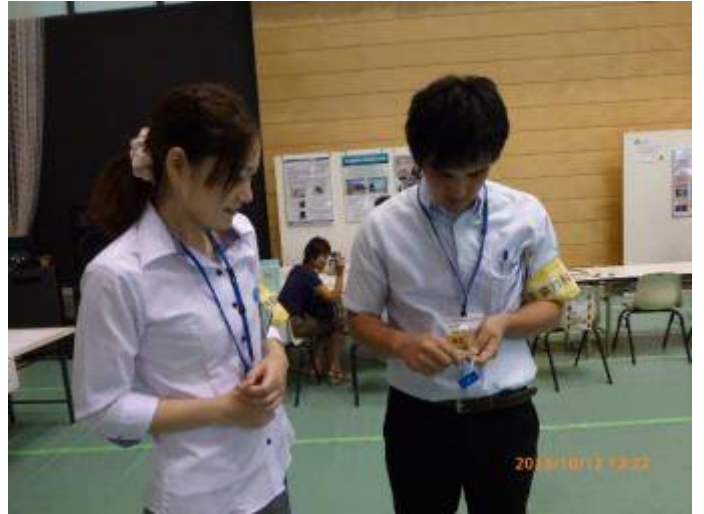
写真8 男女のスタッフが珍しそうに寄って来た。