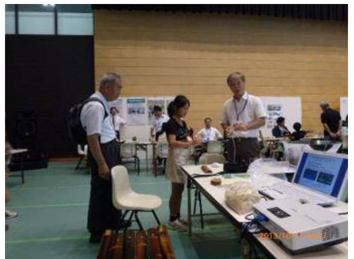
写真18 ブースが入り口にあるので特等席