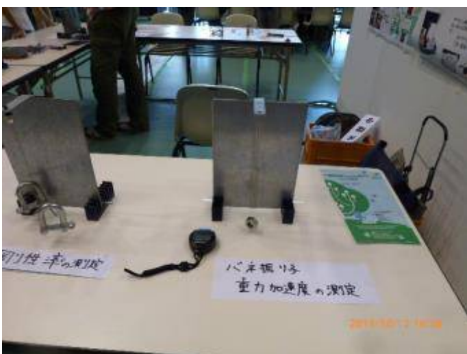
写真 23 バネ振り子：重力加速度の測定