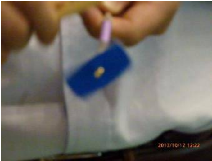
写真9 「ギシギシプロペラ」というおもちゃ