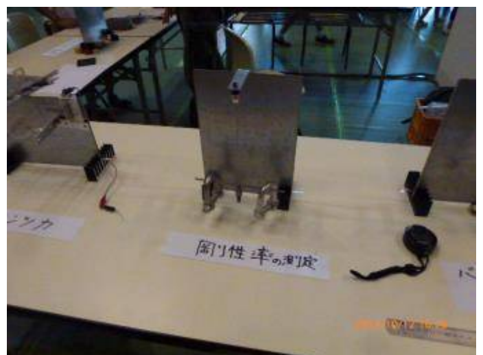
写真 24 剛性率の測定：線を使ってねじり剛性