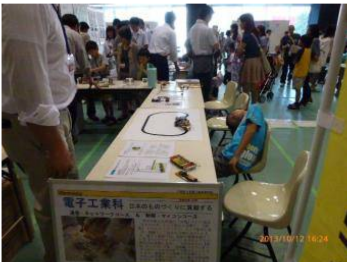
写真 21 電子工業科のブース