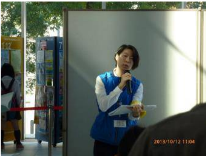
写真3 注意事項を述べる女性スタッフ