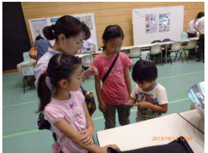
写真12 やっと家族4人が来てくれた。