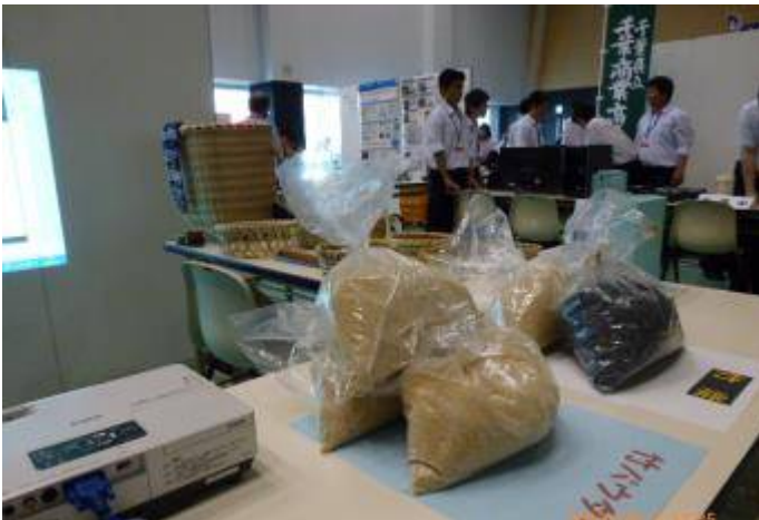
写真5 竹粉、竹炭、竹かごなど