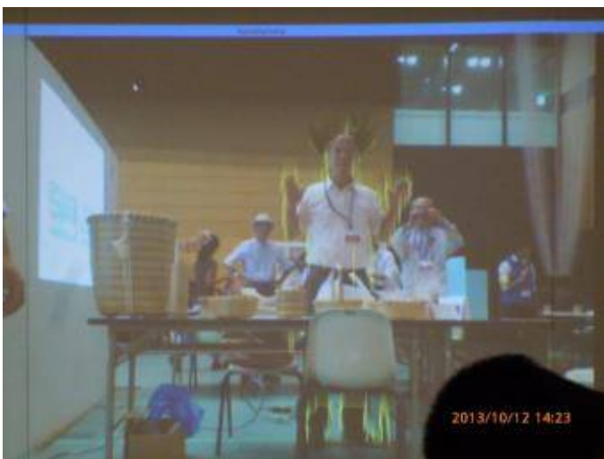
写真17 隣のカメラに映った当方の様子