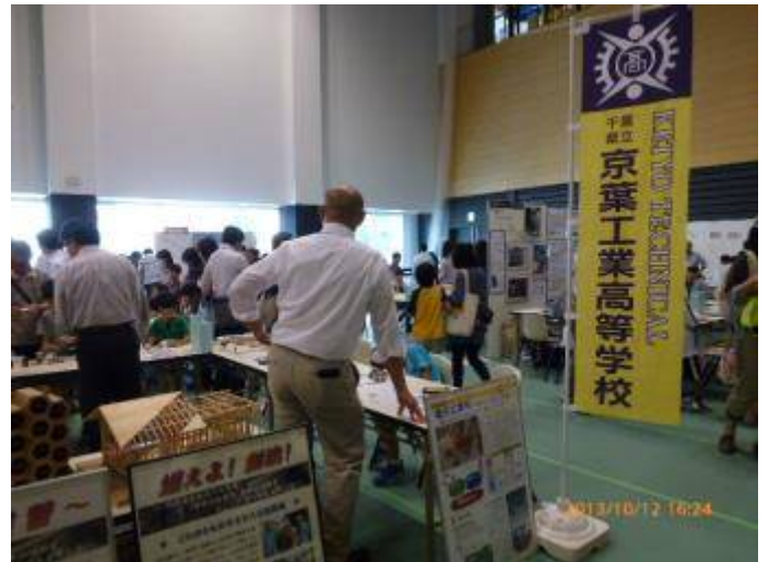
写真 20 京葉工業高校の出展ブース