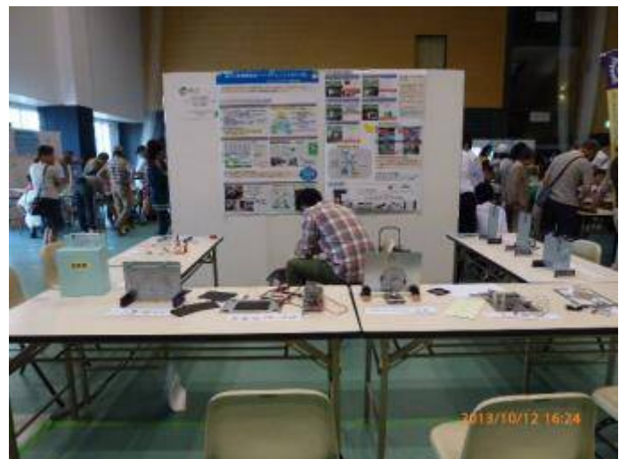
写真 22 千葉大のブース