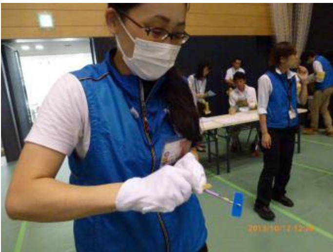
写真11 マスクをしたスタッフもトライ (まだ暇)