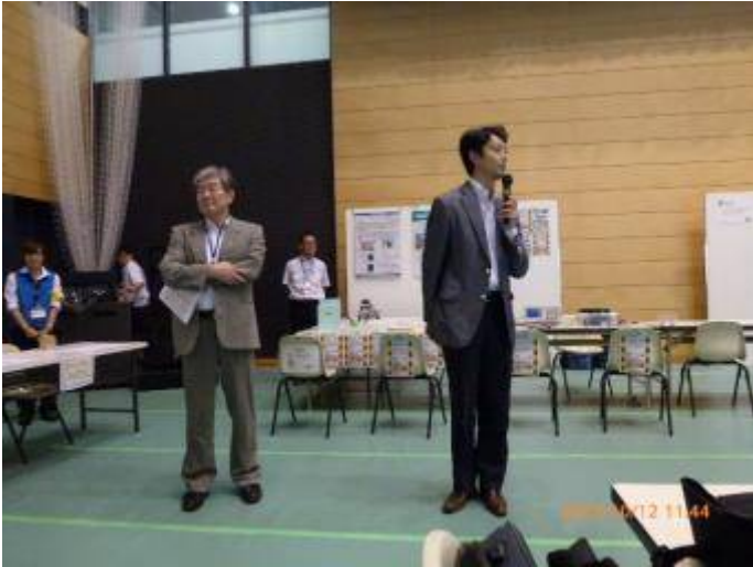
写真7 3F会場に若い熊谷市長も視察に来た。