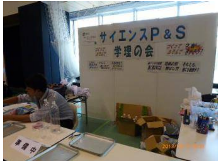
写真 26 サイエンス P&S：学理の会